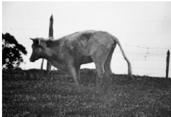
Fig. 2. Sinais de tenesmo (cauda levantada, membros aproximados) na intoxicação experimental pelos frutos de X. cavanillesii em bovinos (Bov. 4).

O Bovino 4, que se recuperou, apresentou o quadro clínico semelhante ao dos animais que morreram, porém, os sinais clínicos foram menos intensos. Os primeiros sinais foram observados 18 horas após a administração e evoluíram num período de aproximadamente 72 horas. Inicialmente ocorreu diminuição do apetite evoluindo para anorexia total e depressão. Apresentava apatia e tremores musculares. Deitava e levantava-se com freqüência, apresentava sialorréia leve e contínua, sudorese leve e pêlos arrepiados. Após 25 horas