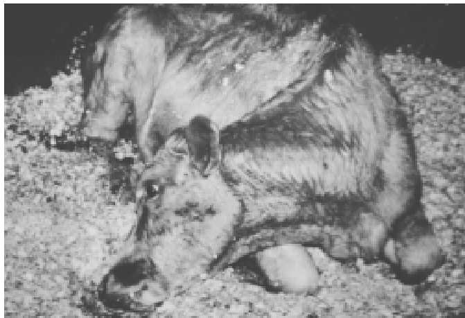
Fig. 1. Decúbito externo, com a cabeça voltada para trás e apoiando o queixo no chão, boca levemente aberta, pêlos da região cervical úmidos devido à sudorese, na intoxicação experimental pelos frutos de Xanthium cavanillesii em bovinos (Bov. 9).

nhar, arrastar as pinças e instabilidade do trem posterior. Os bovinos deitavam-se lentamente e com dificuldade. Para levantarem-se, inicialmente erguiam os membros posteriores, ficando algum tempo com os anteriores flexionados mostrando sinais de fraqueza. Posteriormente assumiam decúbito externo permanente. Voltavam freqüentemente a cabeça em direção ao abdômen e apoiavam o focinho ou o mento no piso da baía (Fig. 1). Alterações respiratórias caracterizavam-se por aumento da freqüência respiratória, respiração laboriosa e ruidosa com curtos períodos de apnéia depois da expiração. Posteriormente assumiam decúbito lateral. Não conseguiam manter o decúbito externo mesmo quando ajudados. Quadros convulsivos ocorreram neste período e foram caracterizados por movimentos de pedalagem rápidos e vigorosos, alternando entre pedalagem dos membros anteriores e posteriores ou apenas dos anteriores. Entre esses movimentos de pedalagem eram observados espasmos tetânicos acentuados nos membros anteriores e posteriores. Os espasmos musculares eram mais fortes nos posteriores. A intensidade e freqüência de espasmos diminuía próximos à morte. O Bovino 7 apresentou hipotermia aproximadamente 1 hora antes da morte. Nessa fase foi notado que os bovinos voltavam progressivamente a cabeça para trás e apresentavam fluxo pequeno e contínuo de espuma branca pela boca. Finalmente observavam-se períodos de apnéia acompanhados de inspiração profunda com gemidos, ranger de dentes, e morte.